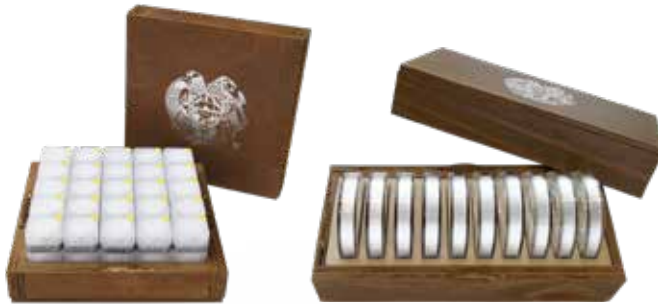
^ Masterbox mit Tubes 20 Münzen je Tube